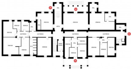
PIANO TERRA FORMATO A4 / SCALA 1:200