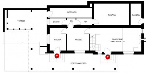
PIANO TERRA SCALA 1:100 FOMRATO A4