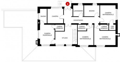
PIANO PRIMO SCALA 1:100 FOMRATO A4