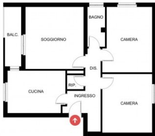
PIANO TERZO SCALA 1:50 FORMATO A3