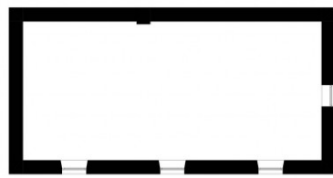
PIANO SECONDO SCALA 1:50 FORMATO A3