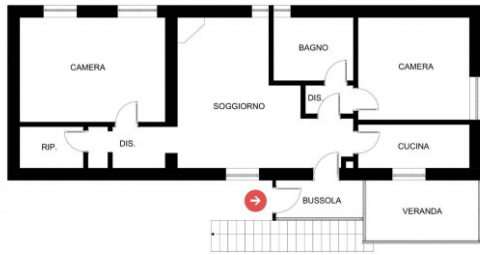
PIANO PRIMO FORMATO A3 SCALA 1:50