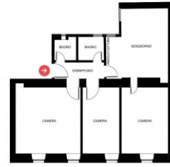
PIANO QUARTO SCALA 1:100 FORMATO A4